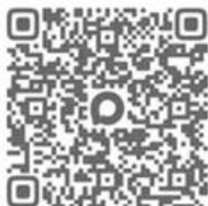
Канал в MAX